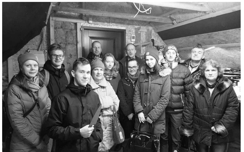
Priekuļu pagasta “Nīmaņos” SIA “AUTINE” darbnīcā