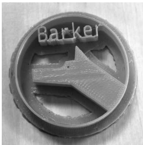
3D printētais logo