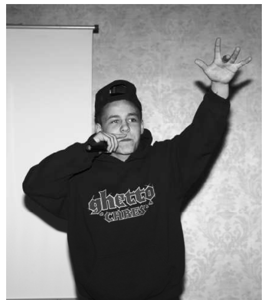
Skatītāju simpātija Basta