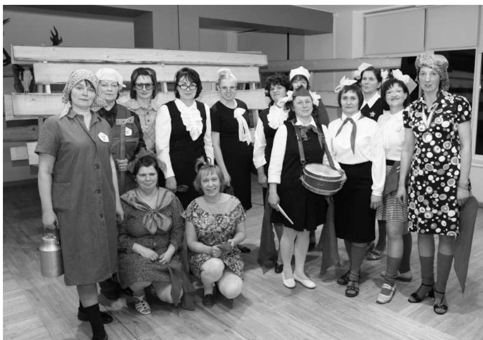
Naukšēnu novada vidusskolas radošais kolektīvs

"Skolā iet mums ļoti patīk, Katru rītu draugus satikt, Klausīties, kā zvaniņš dzied, Aicinot mūs klasē iet."